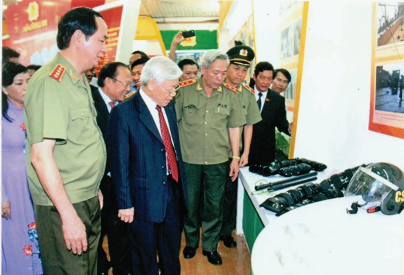
Tổng Bí thư Nguyễn Phú Trọng tham quan Triển lãm quốc gia “Thành tựu kinh tế - xã hội năm 2015” tại Hà Nội, ngày 02/9/2015

(Những phát biểu chỉ đạo, bài viết và hình ảnh của Tổng Bí thư Nguyễn Phú Trọng đối với lực lượng Công an nhân dân Việt Nam)