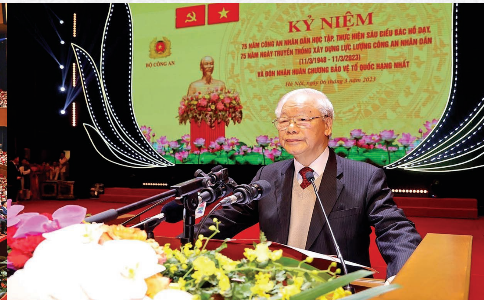
Tổng Bí thư Nguyễn Phú Trọng phát biểu chỉ đạo tại Lễ kỷ niệm 75 năm Công an nhân dân học tập, thực hiện Sáu điều Bác Hồ dạy, ngày 06/3/2023