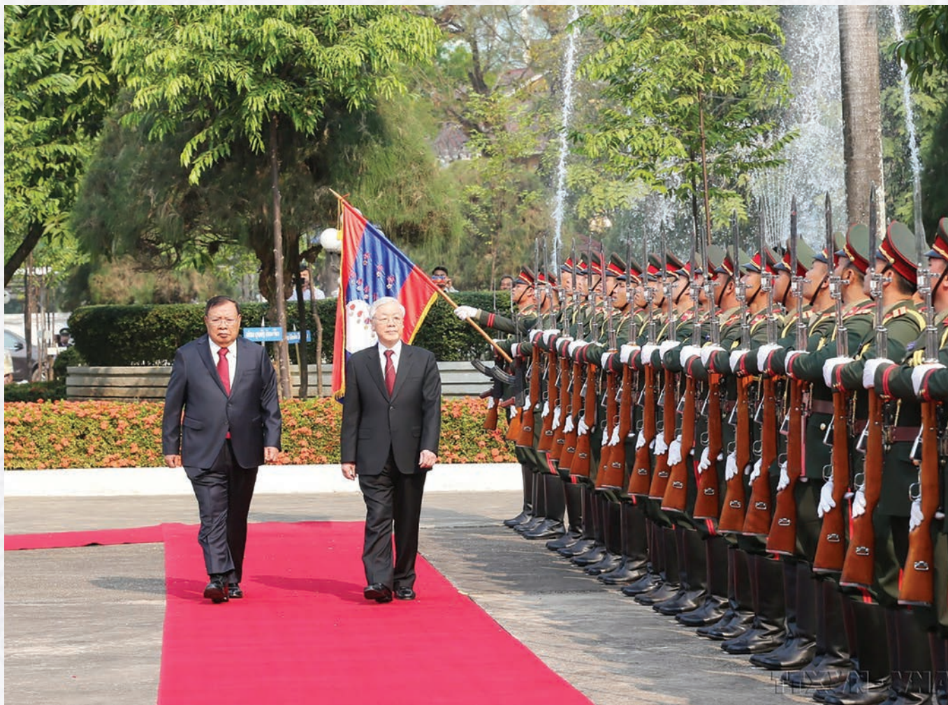
Lực lượng Công an bảo vệ tuyệt đối an toàn chuyến công tác của Tổng Bí thư, Chủ tịch nước Nguyễn Phú Trọng thăm và làm việc tại Lào, năm 2019