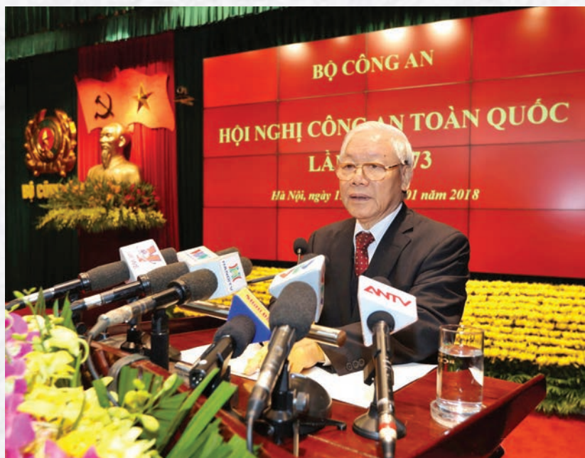
Tổng Bí thư Nguyễn Phú Trọng dự và phát biểu chỉ đạo tại Hội nghị Công an toàn quốc lần thứ 73, ngày 15/01/2018