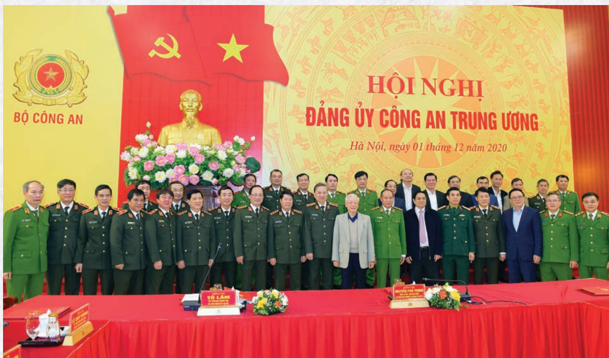
Tổng Bí thư, Chủ tịch nước Nguyễn Phú Trọng dự và phát biểu chỉ đạo tại Hội nghị Đảng ủy Công an Trung ương, ngày 01/12/2020