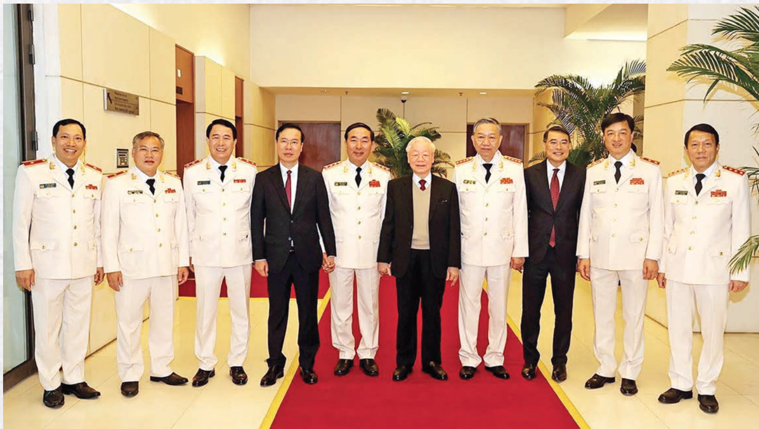
Tổng Bí thư Nguyễn Phú Trọng, Chủ tịch nước Võ Văn Thưởng và các đồng chí lãnh đạo Bộ Công an tại Lễ kỷ niệm 75 năm Công an nhân dân học tập, thực hiện Sáu điều Bác Hồ dạy, ngày 06/3/2023