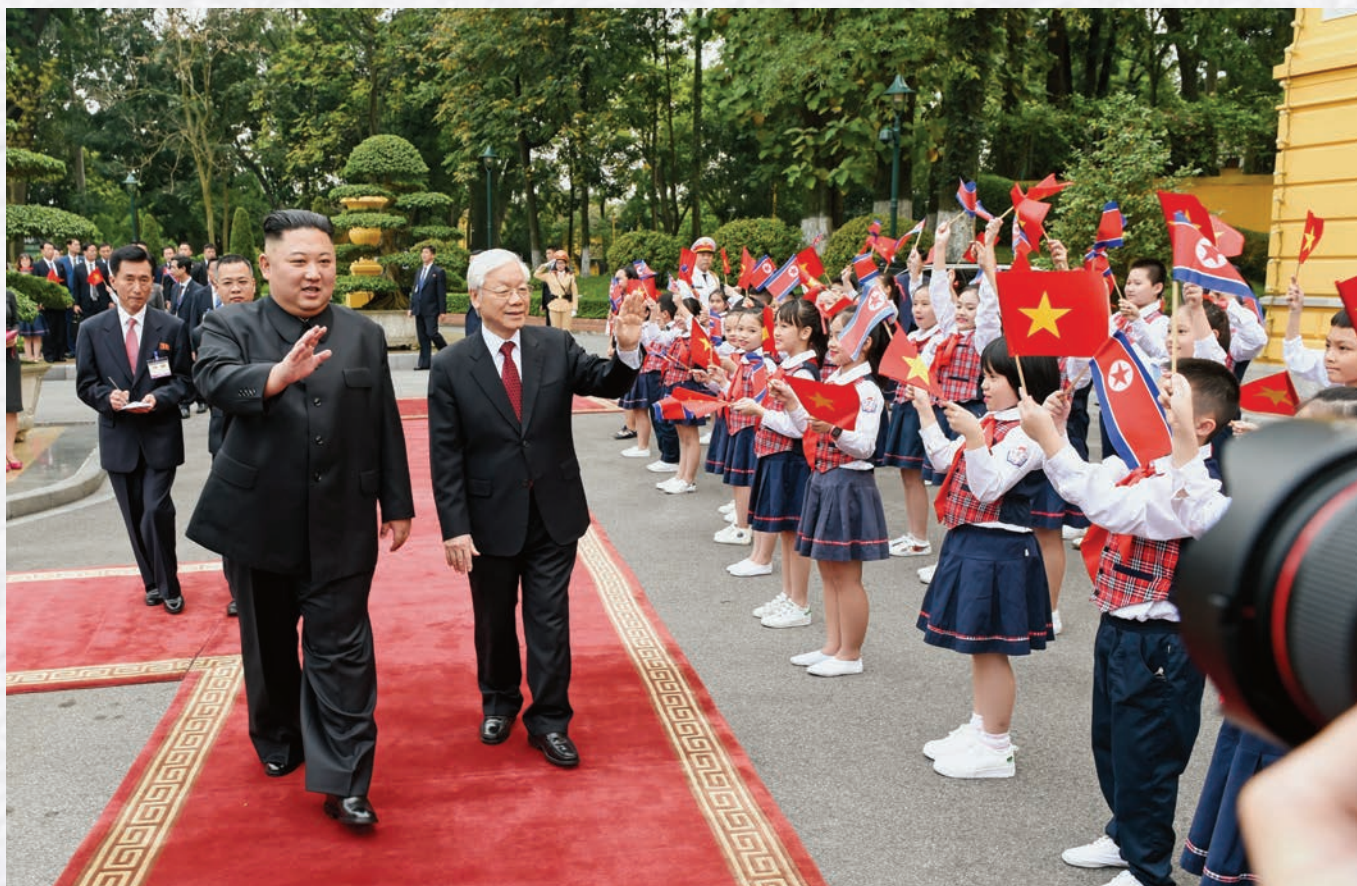
Lực lượng Công an bảo vệ Tổng Bí thư, Chủ tịch nước Nguyễn Phú Trọng đón tiếp Chủ tịch Triều Tiên Kim Jong Un trong chuyến thăm và làm việc tại Việt Nam, ngày 01/3/2019