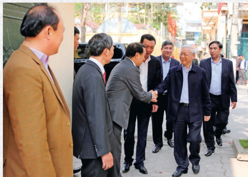
Tổng Bí thư Nguyễn Phú Trọng thăm và làm việc với chính quyền và Công an huyện Xuân Trường, tỉnh Nam Định, năm 2017