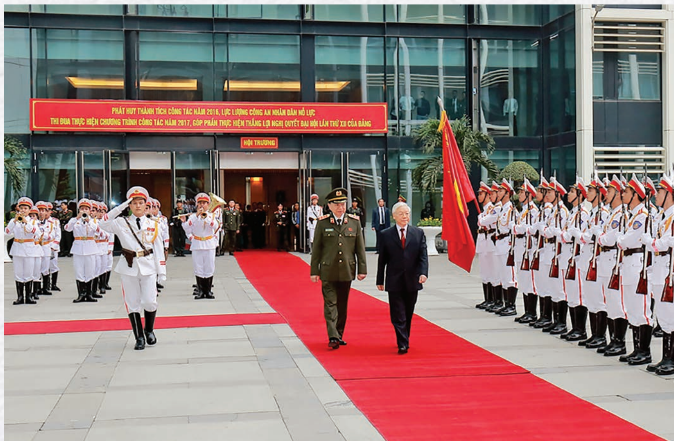
Tổng Bí thư Nguyễn Phú Trọng dự và phát biểu chỉ đạo tại Hội nghị Công an toàn quốc lần thứ 72, ngày 26/12/2016