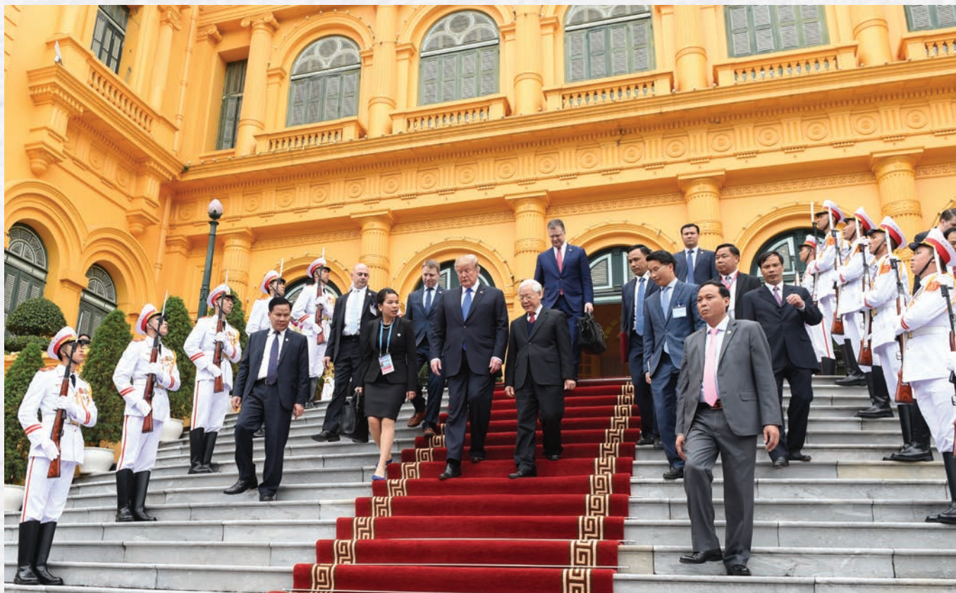
Lực lượng Công an bảo vệ Tổng Bí thư, Chủ tịch nước Nguyễn Phú Trọng đón tiếp Tổng thống Mỹ Donald Trump trong chuyến thăm và làm việc tại Việt Nam, ngày 28/01/2019