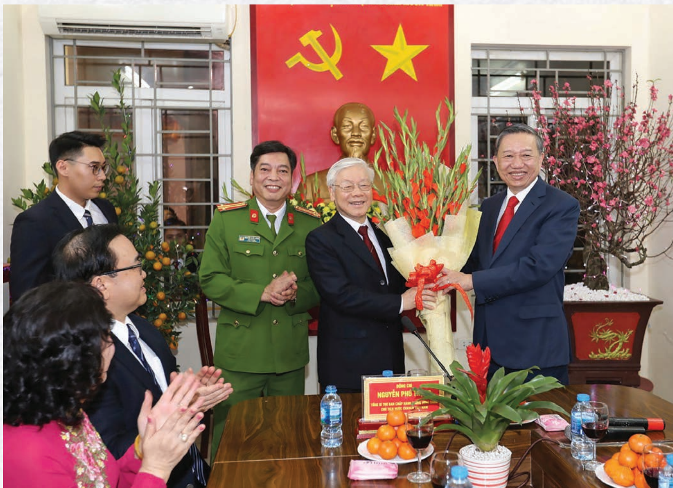
Tổng Bí thư, Chủ tịch nước Nguyễn Phú Trọng thăm và chúc Tết Đội Cảnh sát giao thông, trật tự, Công an quận Ba Đình, thành phố Hà Nội nhân dịp Tết Kỷ Hợi 2019