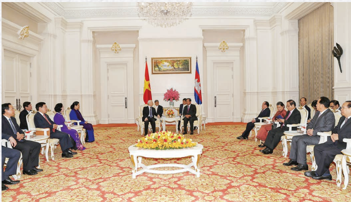
Lực lượng Công an bảo vệ tuyệt đối an toàn chuyến công tác của Tổng Bí thư Chủ tịch nước Nguyễn Phú Trọng thăm và làm việc tại Campuchia, năm 2019