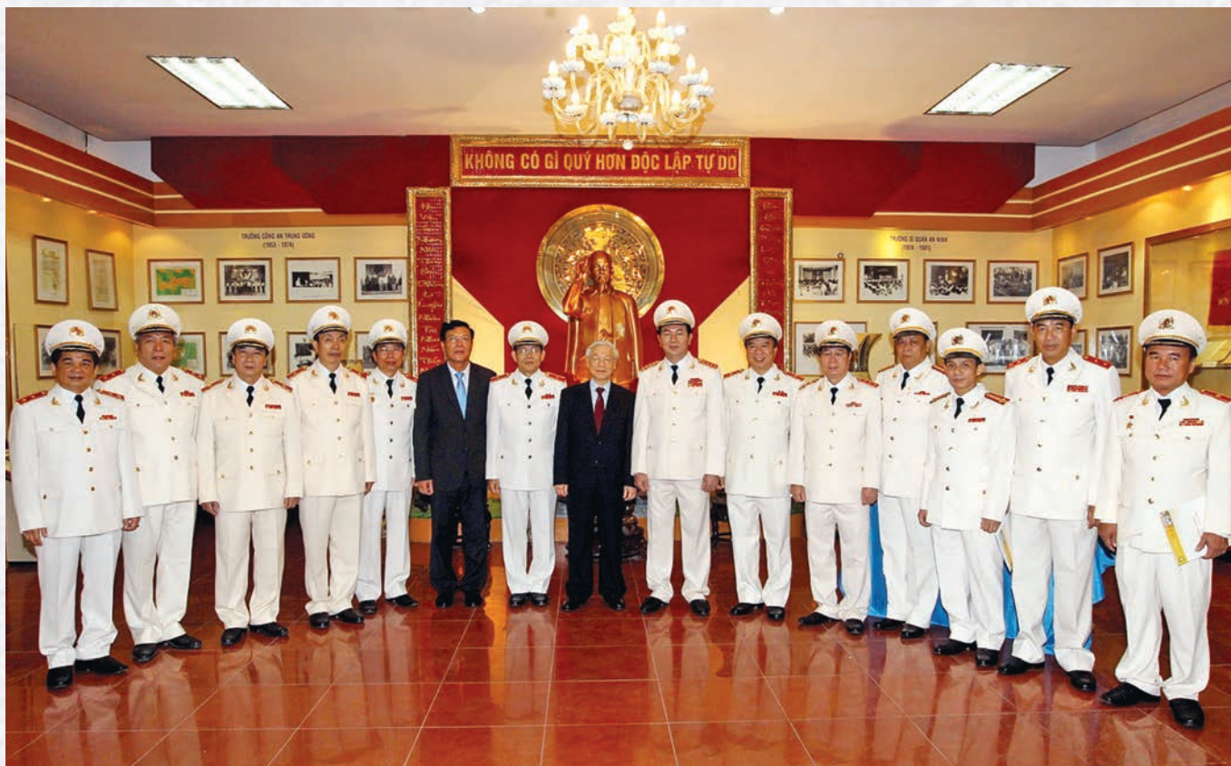
Tổng Bí thư Nguyễn Phú Trọng dự Lễ khai giảng năm học mới 2014 - 2015 tại Học viện An ninh nhân dân, ngày 17/10/2014