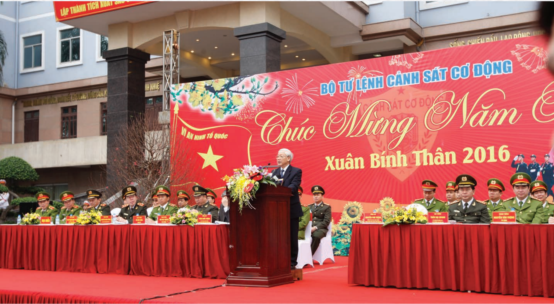
Tổng Bí thư Nguyễn Phú Trọng thăm và làm việc tại Bộ Tư lệnh Cảnh sát cơ động nhân dịp Xuân Bính Thân 2016

(Những phát biểu chỉ đạo, bài viết và hình ảnh của Tổng Bí thư Nguyễn Phú Trọng đối với lực lượng Công an nhân dân Việt Nam)