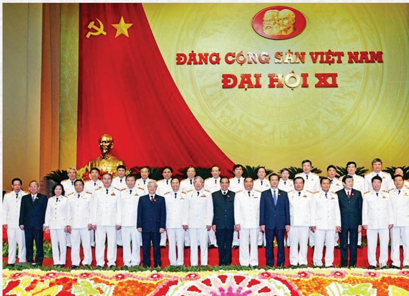
Lãnh đạo Đảng, Nhà nước với Đoàn đại biểu Công an nhân dân dự Đại hội đại biểu toàn quốc lần thứ XI của Đảng, tháng 01/2011