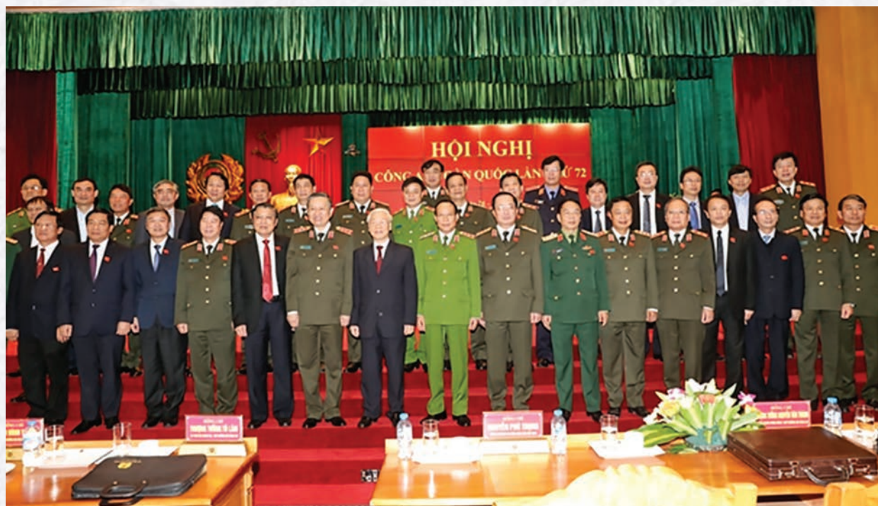
Tổng Bí thư Nguyễn Phú Trọng dự và phát biểu chỉ đạo tại Hội nghị Công an toàn quốc lần thứ 72, ngày 26/12/2016