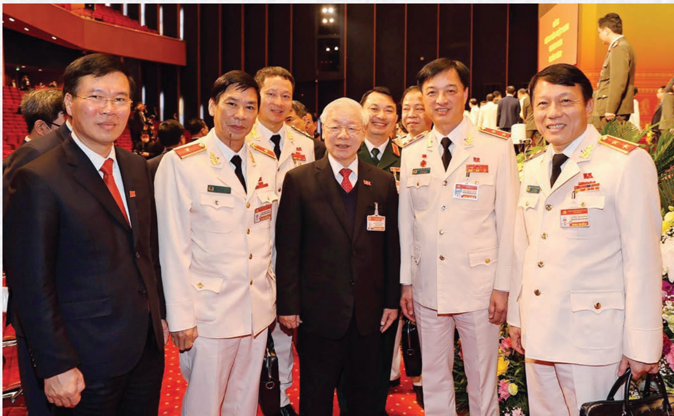
Tổng Bí thư Nguyễn Phú Trọng và các đại biểu Đảng bộ Công an Trung ương dự Đại hội đại biểu toàn quốc lần thứ XIII của Đảng, tháng 01/2021