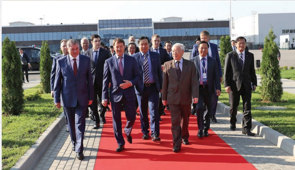
Lực lượng Công an bảo vệ tuyệt đối an toàn chuyến công tác của Tổng Bí thư Nguyễn Phú Trọng thăm và làm việc tại Liên bang Nga, năm 2018