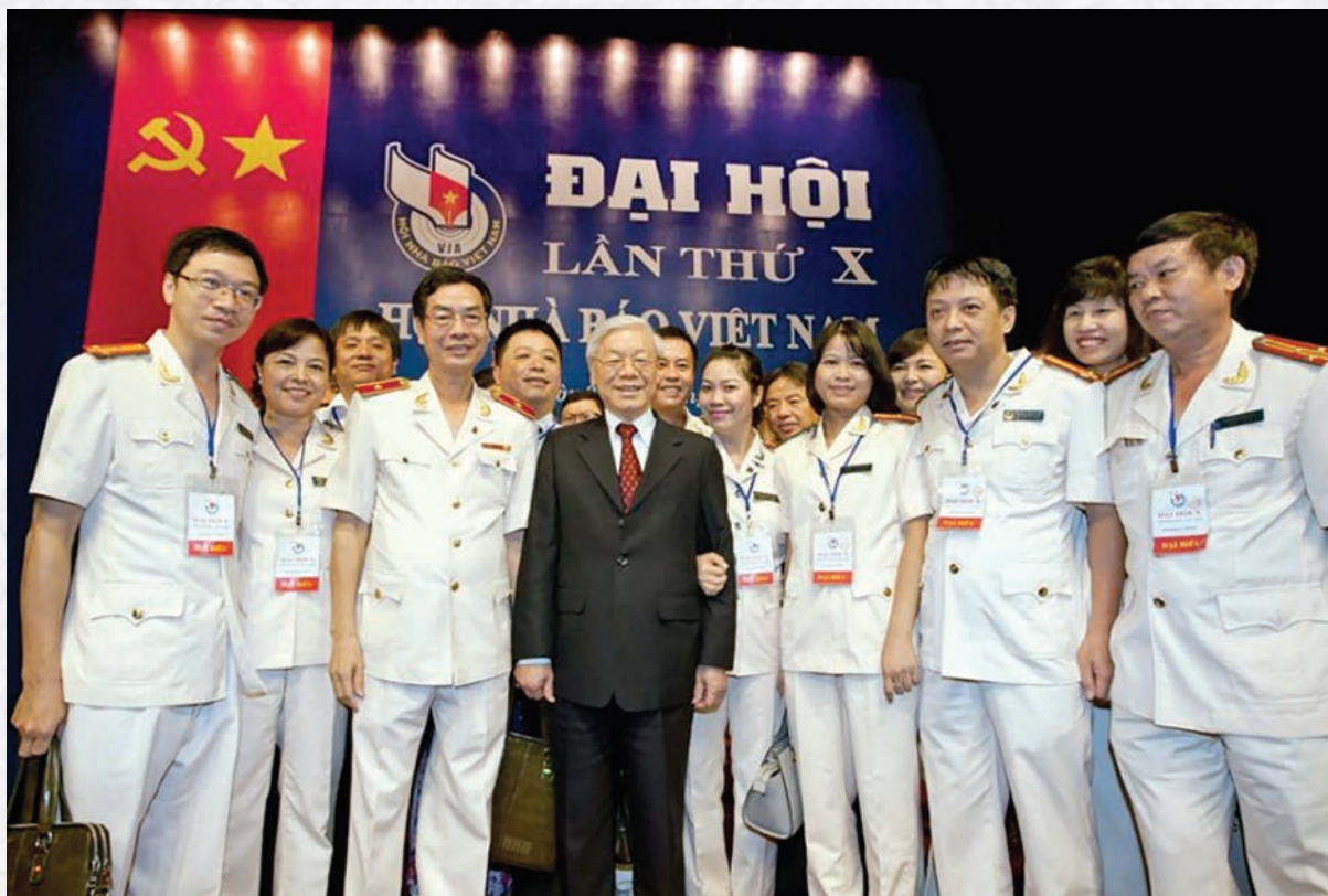
Tổng Bí thư Nguyễn Phú Trọng với đại biểu Công an dự Đại hội lần thứ X Hội Nhà báo Việt Nam, tháng 8/2015