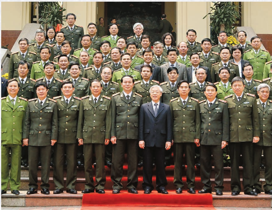
Tổng Bí thư Nguyễn Phú Trọng với các đồng chí lãnh đạo Bộ Công an và lãnh đạo Tổng cục Xây dựng lực lượng Công an nhân dân, ngày 02/4/2012