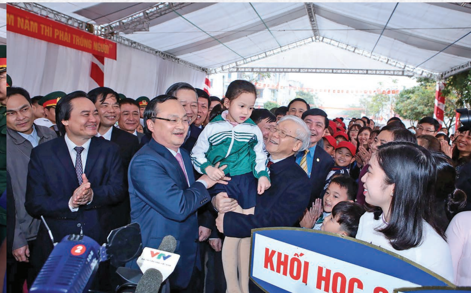
Lực lượng Công an bảo vệ tuyệt đối an toàn đoàn công tác của Tổng Bí thư Nguyễn Phú Trọng thăm, chúc Tết Đảng bộ, chính quyền và nhân dân tỉnh Hưng Yên, năm 2018