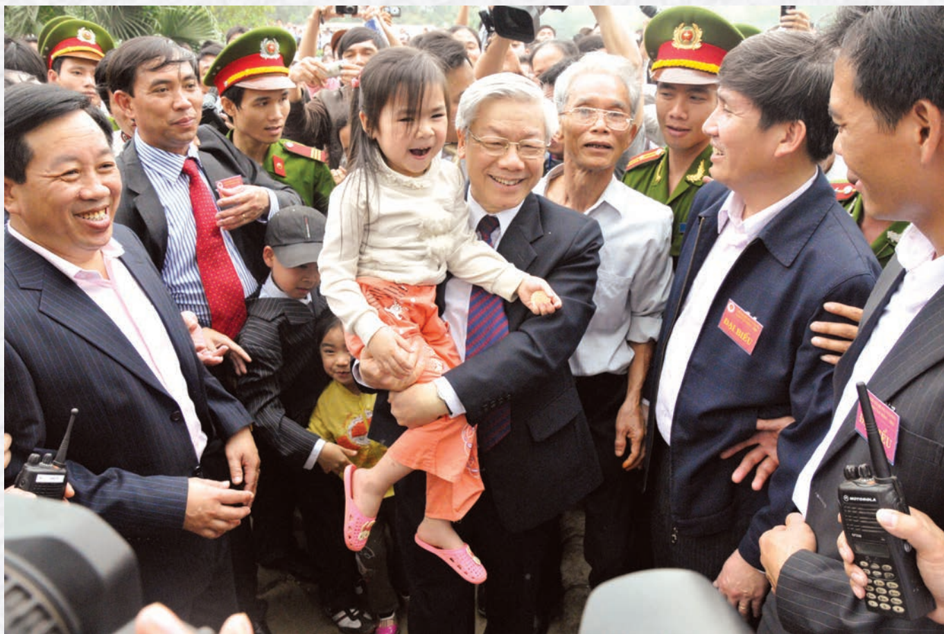
Tổng Bí thư Nguyễn Phú Trọng thăm, làm việc với chính quyền và Công an tỉnh Phú Thọ nhân dịp Xuân Tân Mão 2011