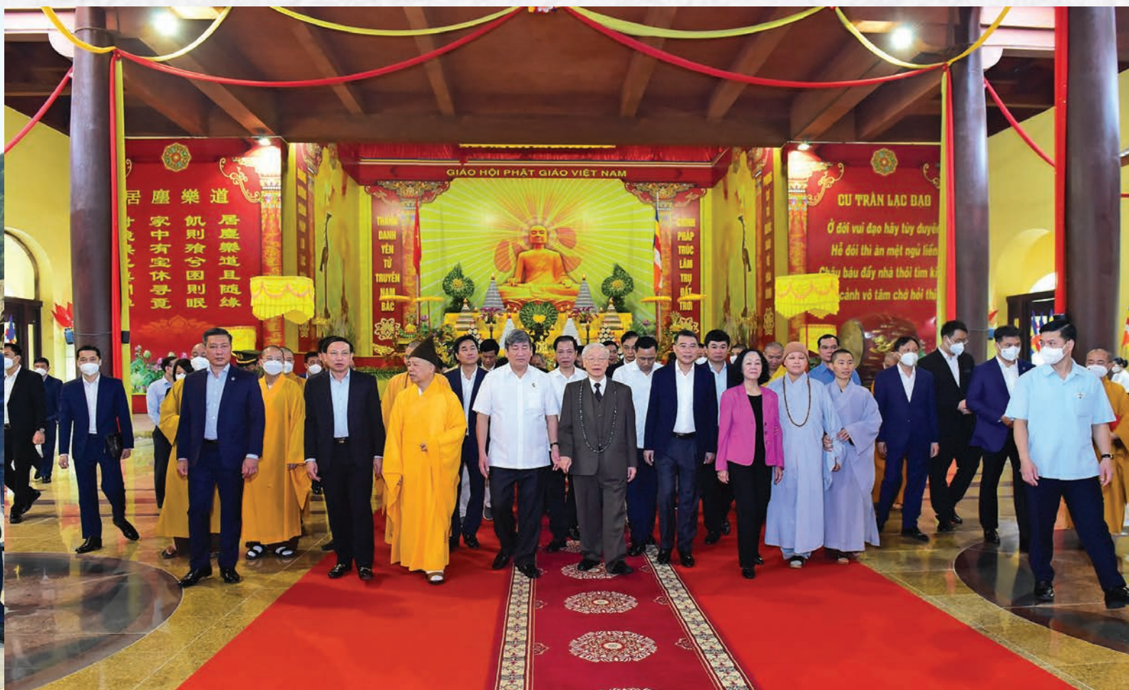
Lực lượng Công an bảo vệ Tổng Bí thư Nguyễn Phú Trọng tham quan Khu Di tích lịch sử văn hóa quốc gia Yên Tử, Uông Bí, Quảng Ninh, ngày 06/4/2022