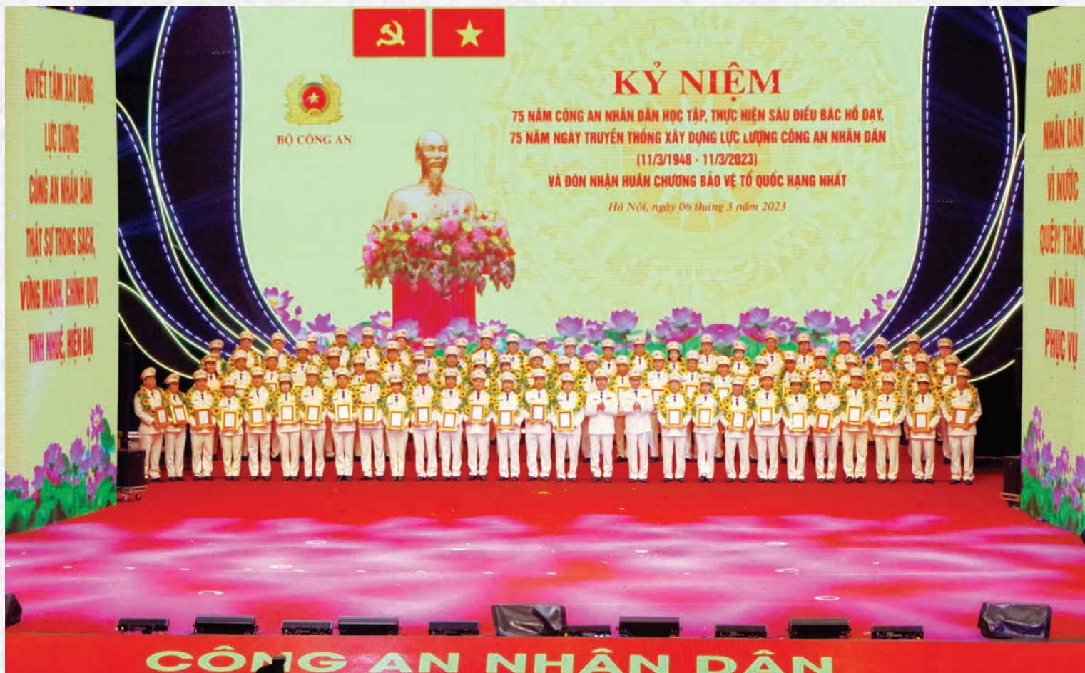
Một số hình ảnh tại Lễ kỷ niệm 75 năm Công an nhân dân học tập, thực hiện Sáu điều Bác Hồ dạy, ngày 06/3/2023

(Những phát biểu chỉ đạo, bài viết và hình ảnh của Tổng Bí thư Nguyễn Phú Trọng đối với lực lượng Công an nhân dân Việt Nam)