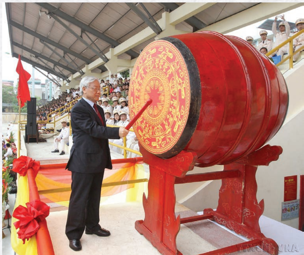
Tổng Bí thư Nguyễn Phú Trọng dự Lễ khai giảng năm học mới 2014 - 2015 tại Học viện An ninh nhân dân, ngày 17/10/2014