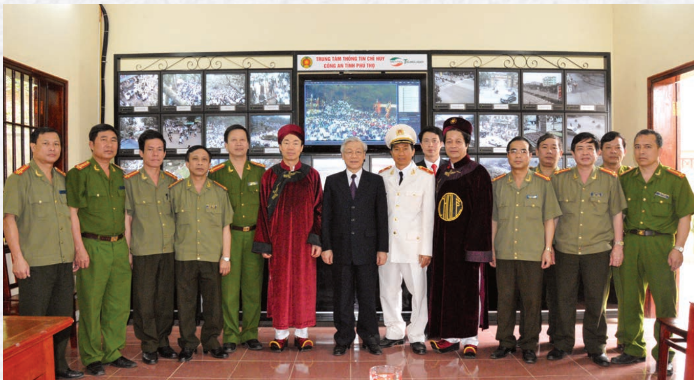
Tổng Bí thư Nguyễn Phú Trọng thăm, làm việc với chính quyền và Công an tỉnh Phú Thọ nhân dịp Xuân Tân Mão 2011