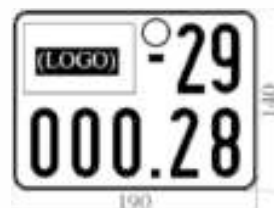
H15: Biển số đăng ký xe mô tô tạm thời

- Kích thước chữ, số, ký hiệu như quy định đối với biển số mô tô trong nước. (Hình vẽ H15)