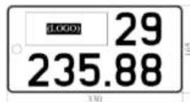
H14: Biển số ngắn

+ Hàng dưới là thứ tự đăng ký, từ 000.01 đến 999.99 (hoặc chữ cái).