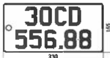
H9: Biển số ngắn