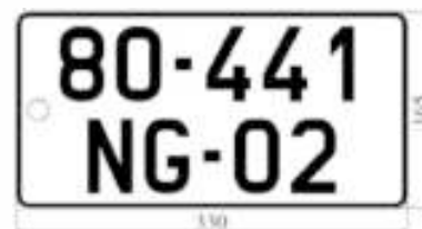
H5: Biển số ngắn