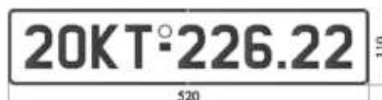
H7: Biển số dài

- Ví dụ: Trên biển số hình vẽ H7 thể hiện: