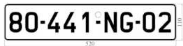
H5: Biển số dài