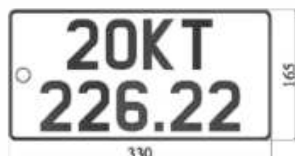
H7: Biển số ngắn

- Đối với biển số ngắn: Ký hiệu địa phương nơi đăng ký và số tự nhiên biển số đăng ký được đặt ở chính giữa hàng phần trên của biển số. Nhóm 5 số hàng dưới là thứ tự đăng ký được sắp xếp cân đối với nhóm số và chữ hàng trên của biển số.