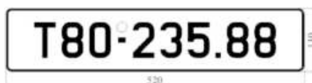
H11: Biển số dài

Ví dụ: Trên biển số hình vẽ H11 thể hiện: