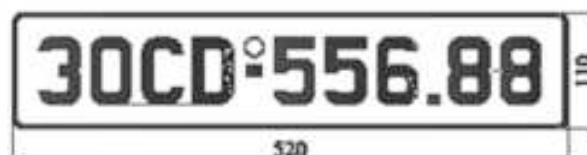
H9: Biển số dài