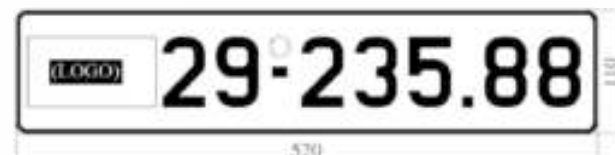
H14: Biển số dài

Ví dụ: Trên biển số hình vẽ H14 thể hiện: