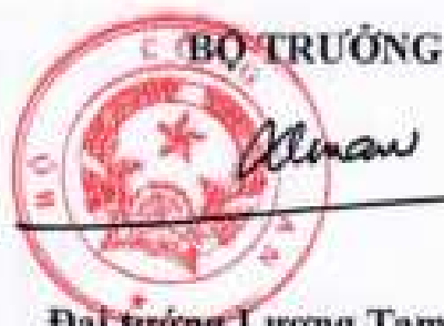
Đại tướng Lương Tam Quang